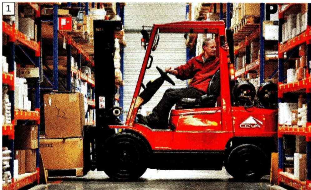
1 Un magazzino di Ceva Italia