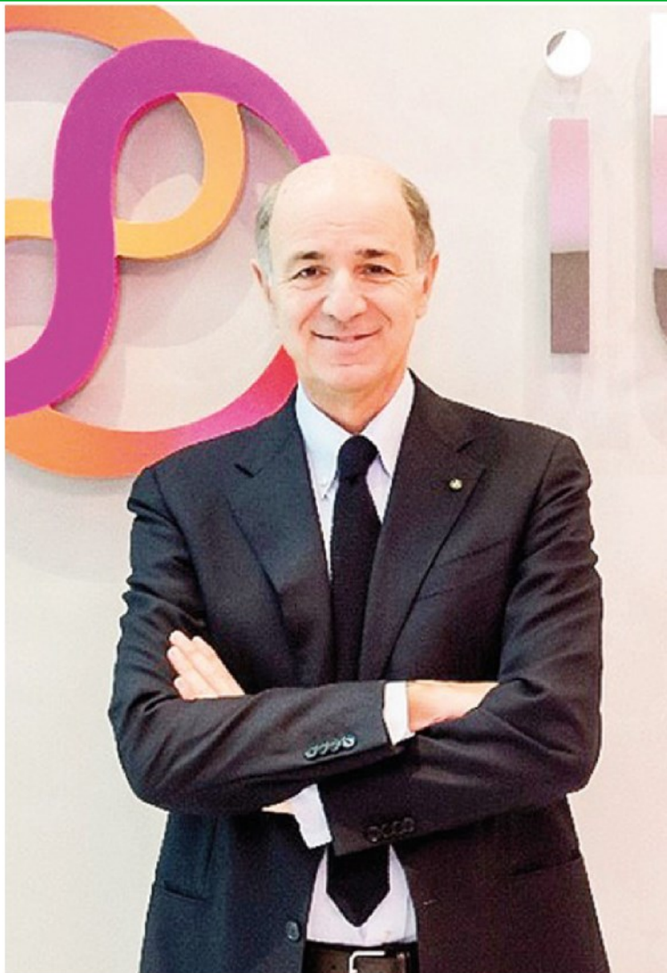
Manager e imprenditore. Corrado Passera, fondatore di Illimity