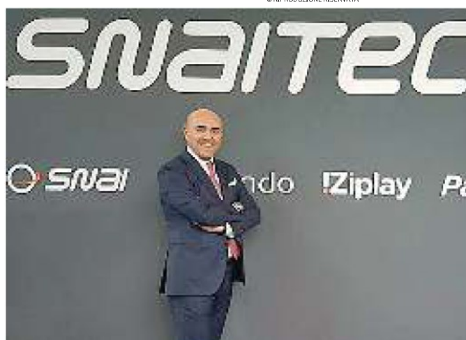
Snaitech. L'amministratore delegato Fabio Schiavolin